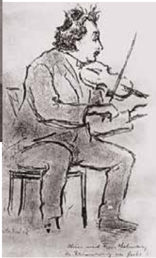
Albert Einstein mit Violine, Lithographie von Emil Orlik, um 1928.