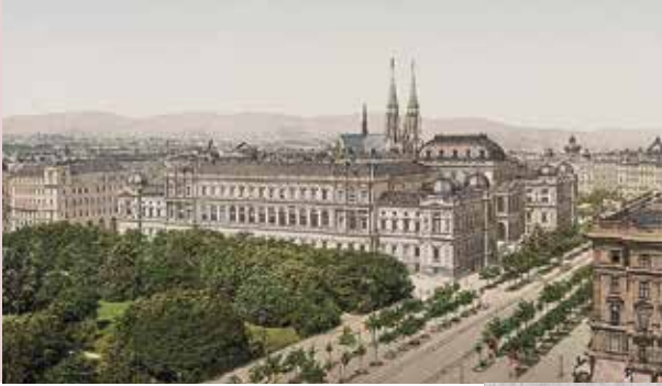
Die Universität Wien, um 1900.