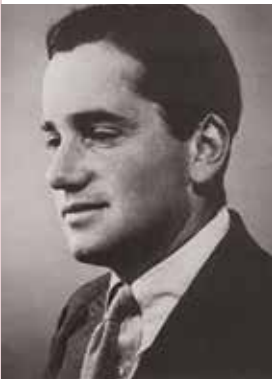
Otto Robert Frisch, Neffe von Lise Meitner.

Nobel-Institut für Physik in Aussicht gestellt hatte. Im Oktober 1938 nahm sie dort ihre Tätigkeit auf.