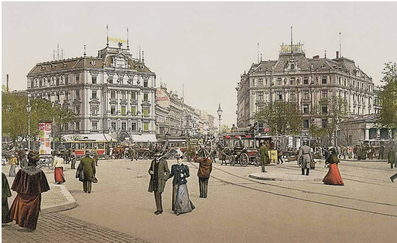
Berlin, Potsdamer Platz, um 1900.

Leben hat sie wissenschaftlichen Ehrgeiz und persönliche Empfindung der jeweils bearbeiteten Forschungsaufgabe untergeordnet.«